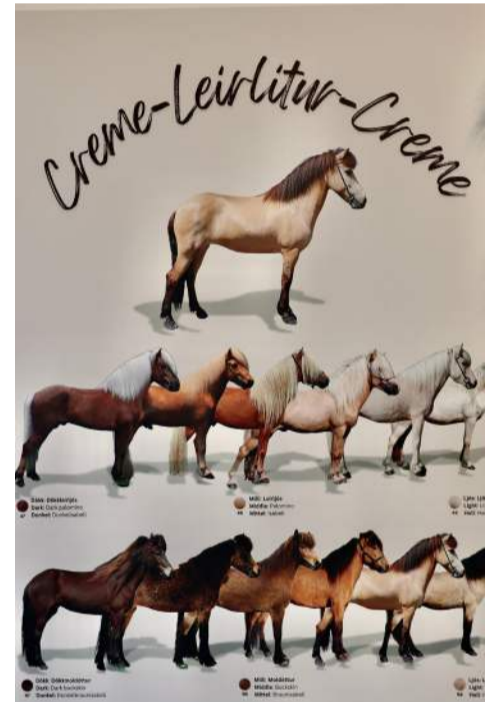
Á efri hæð setursins er sýning sem fjallar um líti, erfðir og ættir íslenska hestsins.