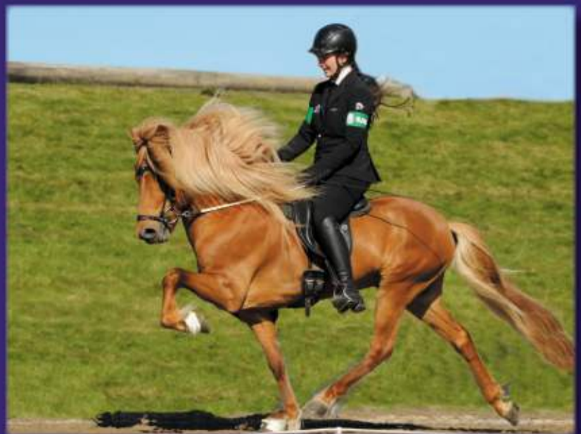
Frosti frá Hjarðartúni Sk: 8.56 H: 8.77 Ae: 8.70 blup: 133

Peir sem hafa áhuga á að nota Frosta verða að nýta sér sumarið þar sem hann heldur til nýrra heimkynna í Sviss í haust.