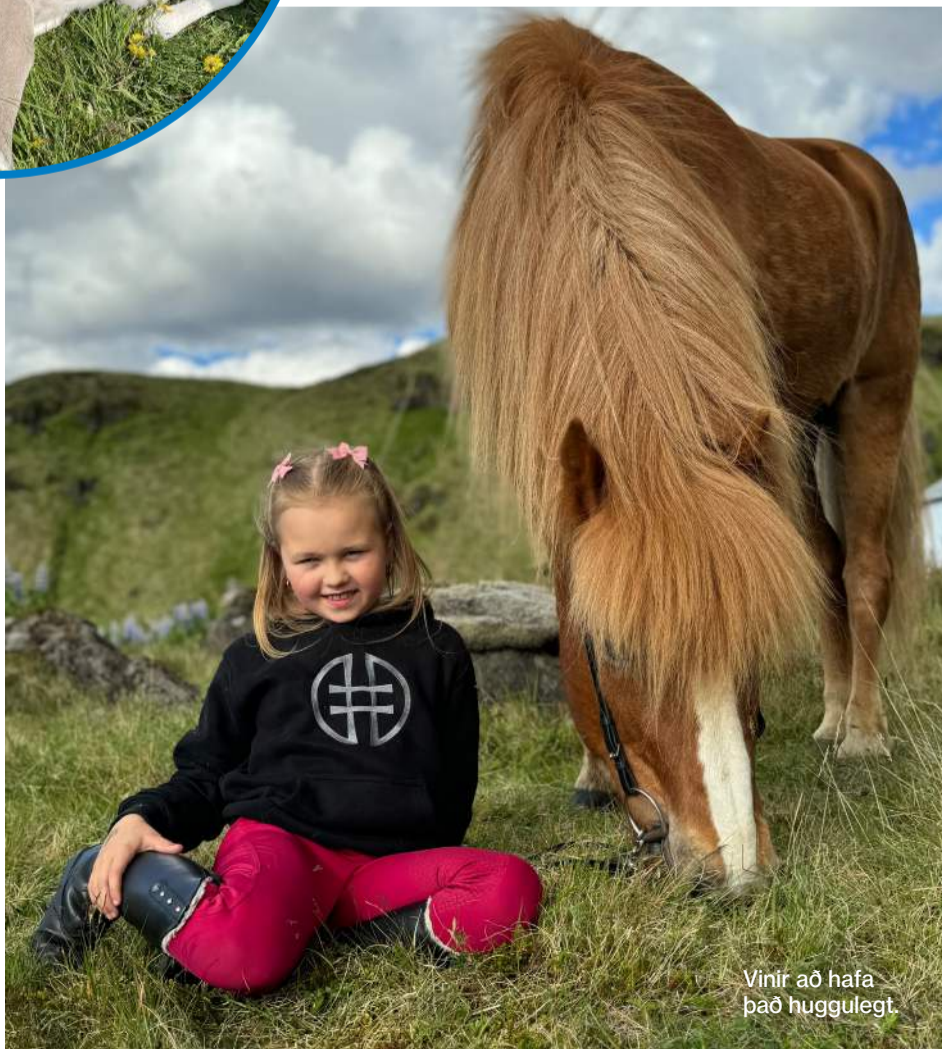
Vinir að hafa það huggulegt.