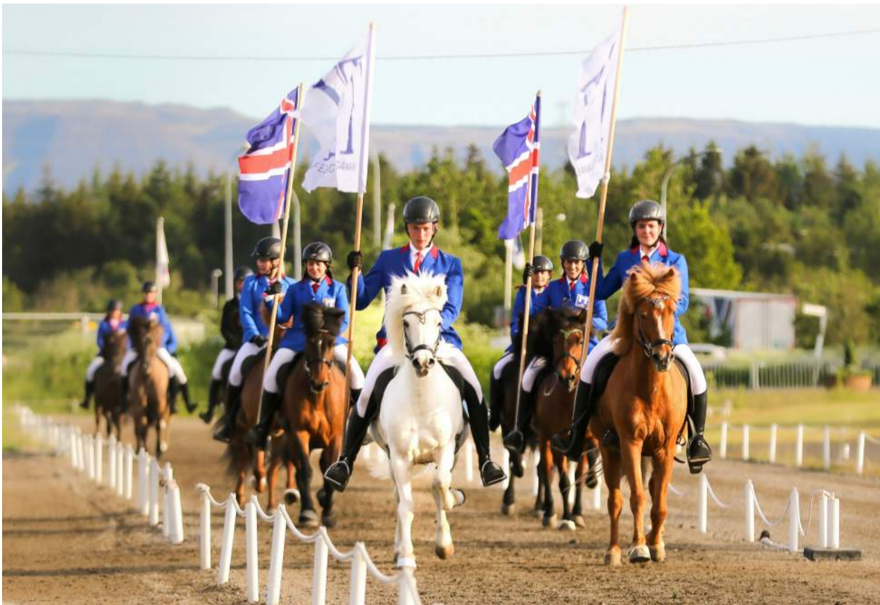
Landsmót hestamanna fer fram á Hólum í Hjaltadal þar sem mætast bestu hestar landsins, afreksknappar, áhugamenn og keppendur á öllum aldri. Kynbótasýningar eru stór hluti af mótinu og þar verða sýnd hross í öllum aldursflokkum.

Keppendur koma úr öllum áttum og aldursflokkum, allt frá tíu ára börnum upp í knapa á áttæðisaldri. Með nýja ungmennaflokknum fá yngri knapar tækifæri til að spreya sig á stærra sviði og undirbúa sig fyrir keppni í fullorðinsflokk síðar.