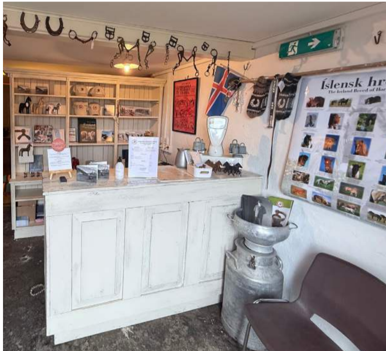
Saga íslenska hestsins er samofin sögu þjóðarinnar og Sögusetur íslenska hestsins á Hólum í Hjaltadal hefur miðlað þeirri sögu.