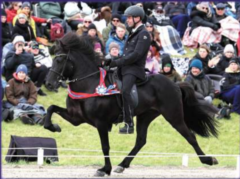
Sindri frá Hjarðartúni Sk: 8.28 H: 9.38 Ae: 8.99 blup: 131

Eftirtaldir stóðhestar sinna hryssum í Hjarðartúni sumarið 2026