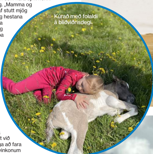
Kúrað með folaldi á blívíðrisdegi.