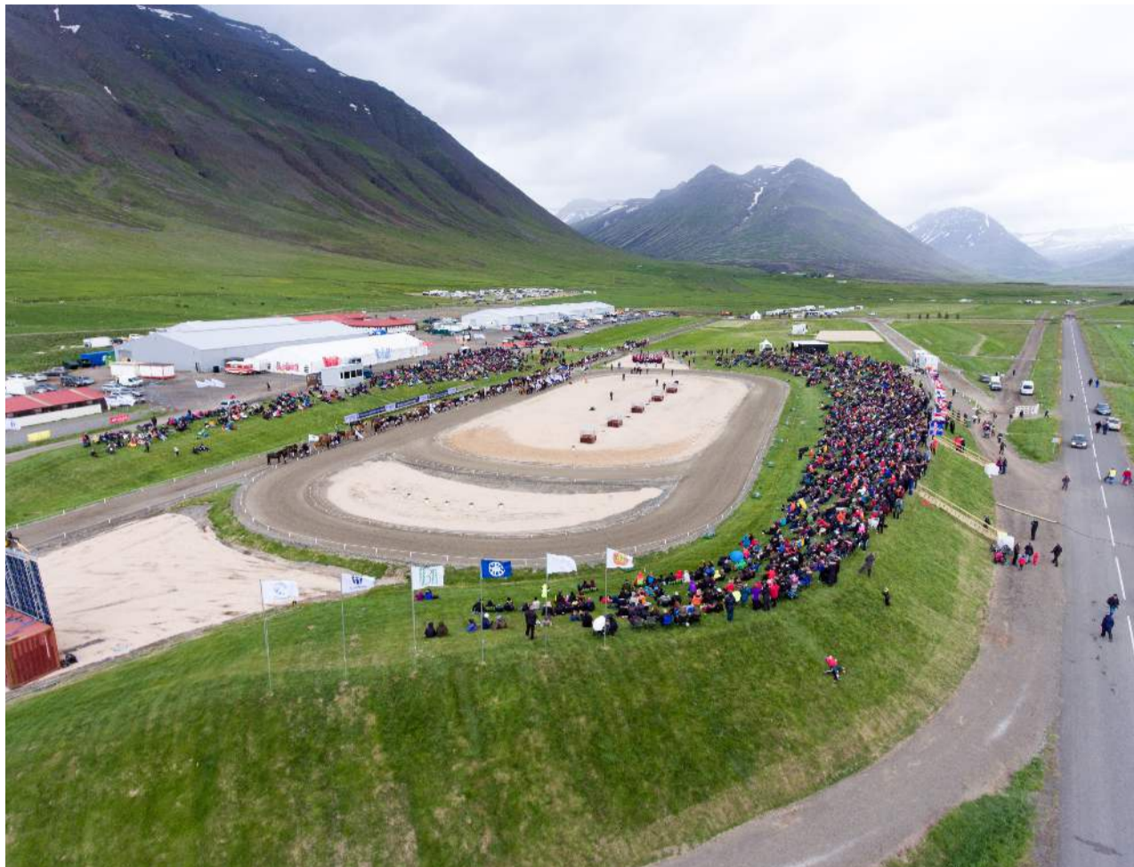
Landsmót hestamanna er skipulagt af hestamannafélaginu Skagfirðingi en um 30 manna hópur hefur komið að undirbúningnum undanfarna mánuði. Þegar mótið hefst verða um 100 manns í vinnu við mótið og um 50 sjálfbóðaliðar.

„Hann hefur heilt yfir gengið vel. Við búum að því að svæðið var byggt glæsilega upp fyrir mótið 2016 og við erum auðvitað að halda það á starfssvæði hestafræðideildar Háskólans á Hólum. Samstarf hér á svæðinu hefur verið mjög gott, sveitarfélagið hefur hjálpað til ásamt fyrirtækjum hérna í héraðinu og