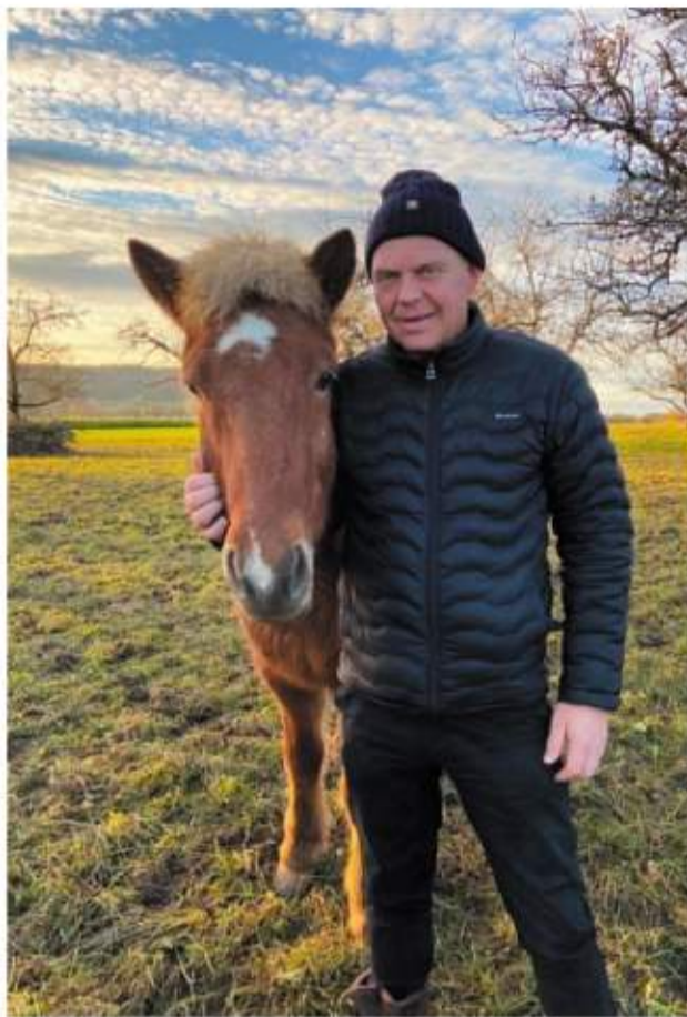
Elvar hefur verið viðloðandi hestamennsku um árabíl.

Landsmót hestamanna er einn stærsti viðburður íslenskrar hestamennsku og laðar að sér bæði keppendur og áhugafólk